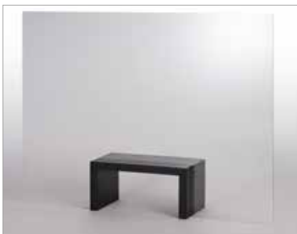
13| Hygieneschutzwand „BRIDGE“ Wenge Öffnung 26 x 13 cm 75 cm | H 57 cm no. 98007 125,00 €