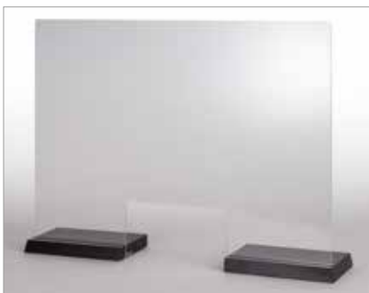
11| Hygieneschutzwand „TILE“ Wenge Öffnung 26 x 13 cm 75 cm | H 57 cm no. 98006 125,00 €