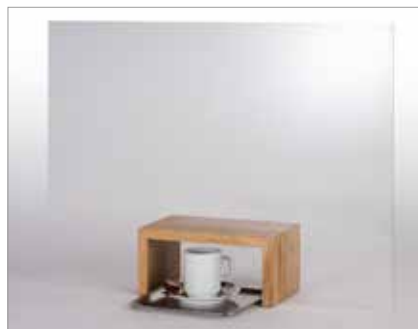
14| Hygieneschutzwand „BRIDGE“ Eiche Öffnung 26 x 13 cm 75 cm | H 57 cm no. 98011 125,00 €