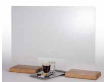
12| Hygieneschutzwand „TILE“ Eiche Öffnung 26 x 13 cm 75 cm | H 57 cm no. 98010 125,00 €